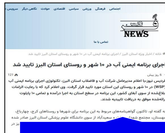
پایگاه خبری فردیس نیوز