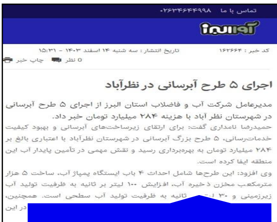
پایگاه خبری آواالبرز