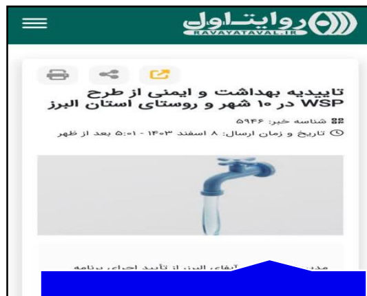
پایگاه خبری روایت اول