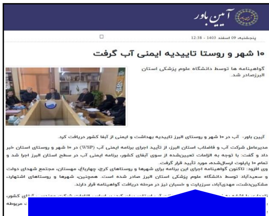
پایگاه خبری آئین باور