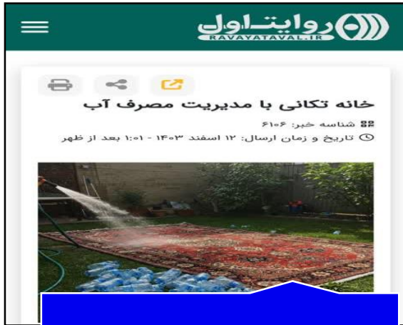
پایگاه خبری روایت اول