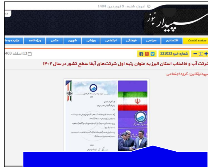
پایگاه خبری سپیدار نیوز