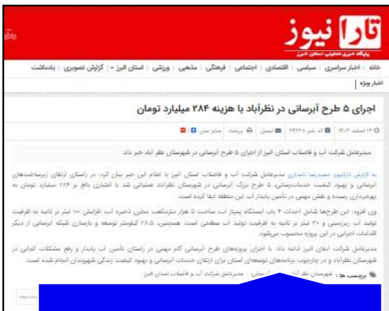
سایت روزنامه جام جم