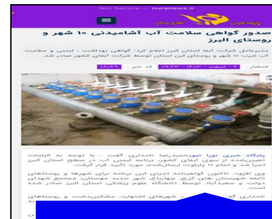
پایگاه خبری نورا