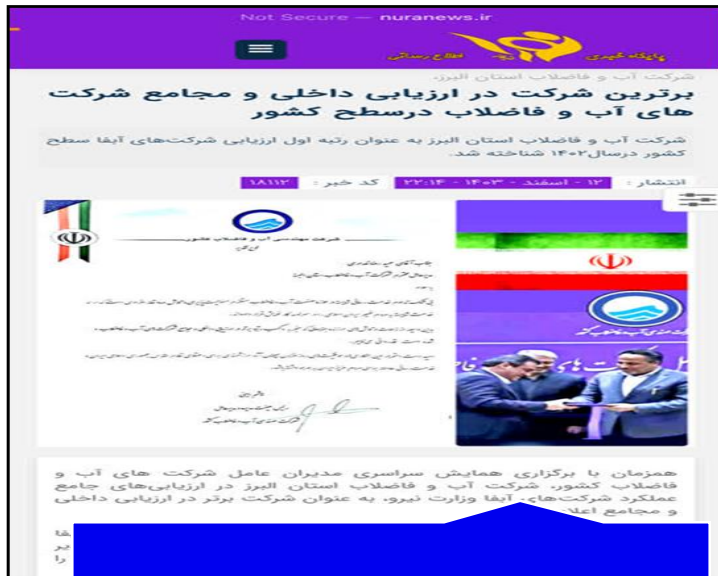
پایگاه خبری نورا