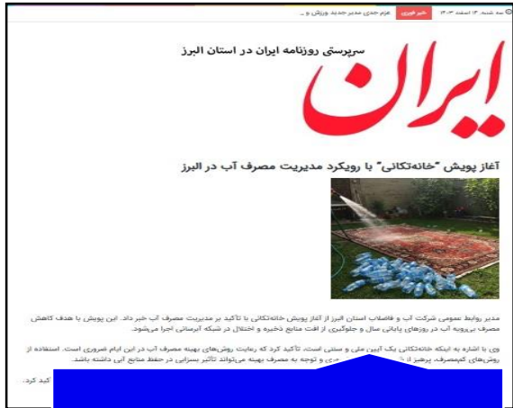
سایت روزنامه ایران