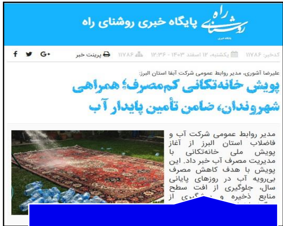
پایگاه خبری روشنای راه