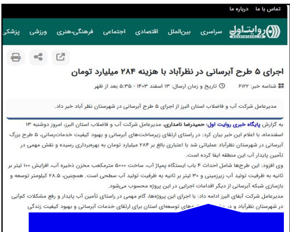
پایگاه خبری روایت اول