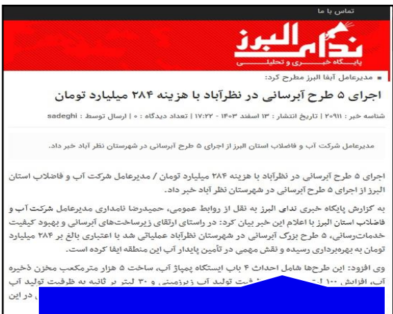
پایگاه خبری ندای البرز