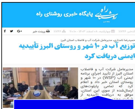
پایگاه خبری روشنی راه